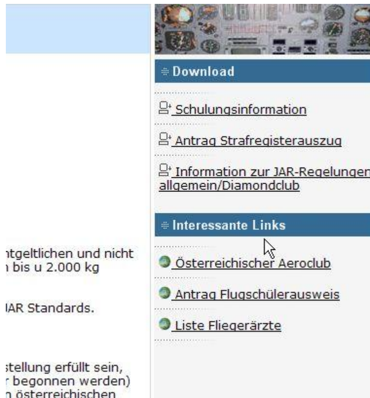
Abbildung 3: Tools-Bereich

Unter dem Punkt Download finden sich Informationen die vom SFCA zur Verfügung gestellt werden und herunter geladen werden können. Dazu gehören im Member Bereich z.B. auch die Handbücher und Checklisten unserer Fluggeräte. Unterhalb befindet sich unter Umständen ein weiterer Bereich mit interessanten Links, die auf andere Websites führen, für deren Inhalt wir auch nicht verantwortlich sind.