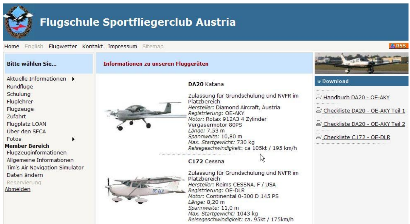
Abbildung 4: Member Bereich

Wird ein Menüpunkt aus dem Memberbereich ausgewählt, wird automatisch die Startseite angezeigt. In diesem Fall ist die zugewiesene Userid mit Passwort einzutragen. Nach erfolgreichem Login wird automatisch auf die gewünschte Seite verzweigt. Will man sich vor beenden der Session abmelden, geschieht dies durch Auswahl von „Abmelden“ im Menü.